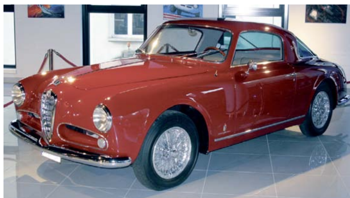
Das 4,40 Meter lange Alfa Romeo 1900 Sprint Coupé wurde ab 1953 mit 85 kW/115 PS starkem 1,9-Liter-Vierzylinder, Viergang-Getriebe und Hinterachs-antrieb gebaut.

Zu den im Alfa Romeo Flagship Store an der Hanauer Landstraße 174 gezeigten Motiven gehören Fahrzeuge wie der grandiose Alfa Romeo 8C 2300 Spider (1931), der unvergessene Duetto (1968), der Alfa Romeo Montreal (1970) und der Renntourwagen Alfa Romeo 155 V6 TI DTM (1994). Aber auch der aktuelle Alfa Romeo Brera und die jüngste Ikone der Mar-