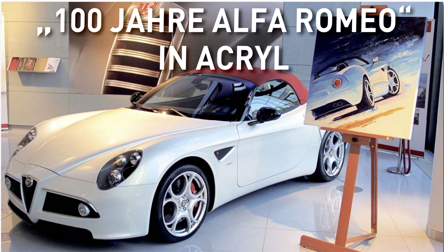
Einer von 500 gebauten Alfa 8C Spider zum Preis von über 211.000 Euro überrascht mit 331 kW/450 PS starkem 4,7-Liter-V8-Motor am Eingang zum Fankfurter Alfa Romeo Flagship Store „in Natura“ und als Bild.