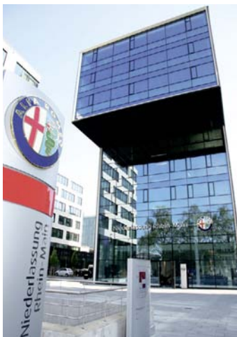
Alfa Romeo Flagship Store in Frankfurt am Main