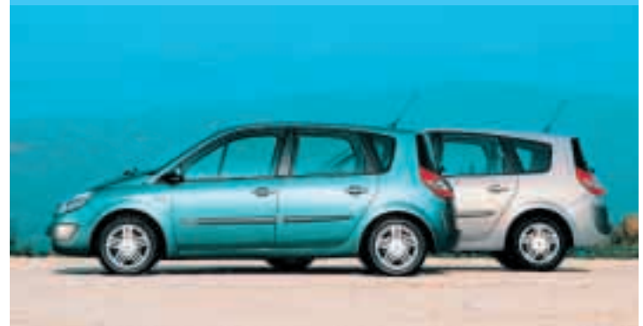
Vier Designlinien und drei Ausstattungsniveaus sichern dem Grand Scénic bei der Individualisierung einen Spitzenplatz unter den Kompaktvans.