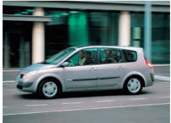
Top-Modell der Mégane-Familie ist beim Raumangebot der Grand Scénic.

... und nächste Woche im Autohandel : VW New Beetle Cabriolet